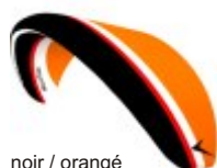
noir / orangé