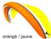
orangé / jaune