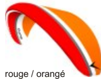
rouge / orangé