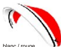
blanc / rouge