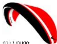
noir / rouge