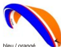
bleu / orangé