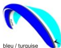
bleu / turquoise