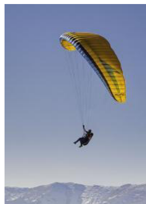
VERHALTEN BEI MIN. STARTGEWICHT (88KG)

Musterbezeichnung SWING Mito 2 RS ML Musterprüfnummer DHV GS-01-2676-22 Inhaber der Musterprüfung Swing Flugsportgeräte GmbH Hersteller Swing Flugsportgeräte GmbH Klassifizierung A Windenschlepp Ja Anzahl Sitze min / max 1 / 1 Beschleuniger Ja Trimmer Nein